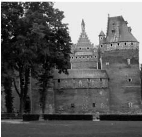
Burcht van Beersel.

Het dorp Beersel waar we ons momenteel bevinden is 631 ha groot en is een woondorp met villa's in het oosten (Schavei). De hoogte varieert van 25 m (Zennevallei) tot 117 m aan de rand met Alseberg en er is nog 42 ha bos. De 5.300 bewoners noemt men Beerse-laars, kaasboeren of boterdiëven . De 1 e vermelding in 847 was Bersalis (van Ber = beer of modder en Sali = woning met één ruimte). De oorsprong ligt in het Hof van Beersel uit de 9 e eeuw. Verscheidene geslachten drukten hun stempel op het dorp: Hellebeke (begin 14 e eeuw), Stalle (14 e eeuw), Wittem (einde 14 e tot 16 e eeuw) en Arenberg (18 e eeuw). De gotische Sint-Lambertuskerk die hier staat, is afgebrand in 1730 en heropgebouwd in 1763 en heeft nogal wat meubilair uit de 18 e eeuw. Achter de kerk ligt de Uwenberg waar schrijver Herman Teirlinck woonde van 1935 tot aan zijn dood in 1967. Zijn woonhuis is nu het Herman Teirlinck-museum . De Puttestraat rechts en de