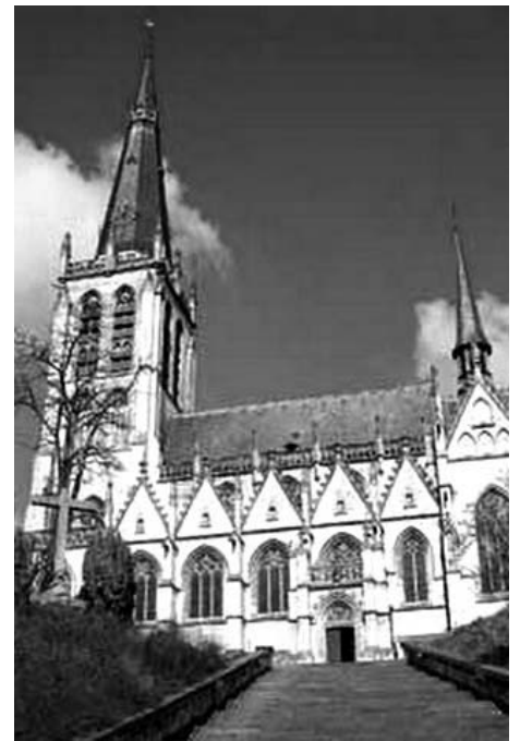
Basiliek van Alseberg.

Dit klein verzorgingscentrum van 619 ha is heuvelachtig en gaat van 56 tot 120 m. Het heeft nog 52 ha bos(jes). De 5.500 inwoners noemt men Alsebergenaars, klokkenuiders , bijters of meubelkloppers . De 1 e vermelding is van 1219 als Alsenberge (van het Germaans Alsan Berga of berg van Also). In 1241 trouwt de Brabantse hertog Hendrik II voor de 2 e maal met Sophie van Thüringen, de dochter van hertog Lodewijk VI van Thüringen en Elisabeth van Hongarije. Als huwelijksge-schenk geeft ze een beeld van O.-L.-Vrouw Ster der Zee aan de toen bestaande Romaanse kapel van Alsem-