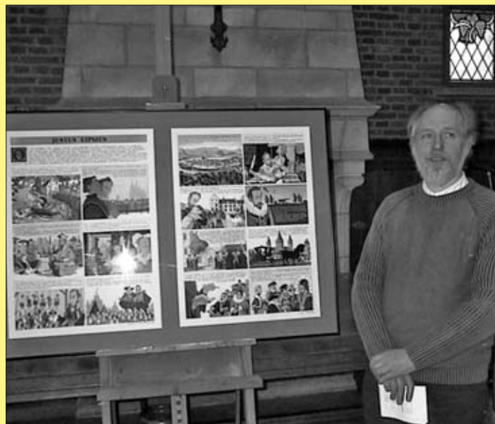
Striptekenaar Castor tekende zowel het leven van Justus als 'de petite histoire' van Luppe.