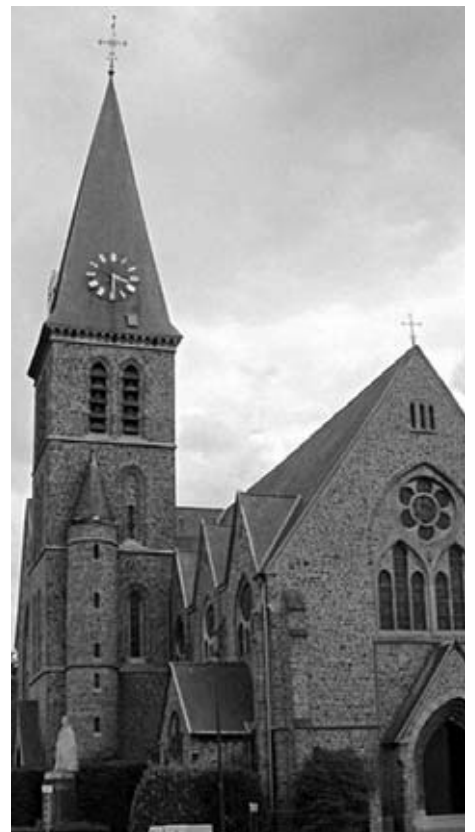
Kerk van Lot.

De Dworpsestraat brengt ons vlug naar het centrum waar we rechts de pastoriestraat nemen tot het Europaplein.