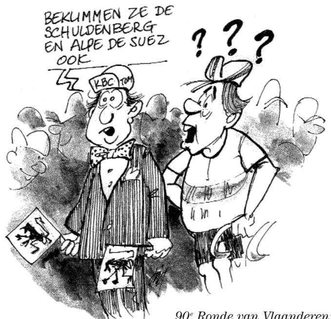
90° Ronde van Vlaanderen: minder volks, meer VIPs.